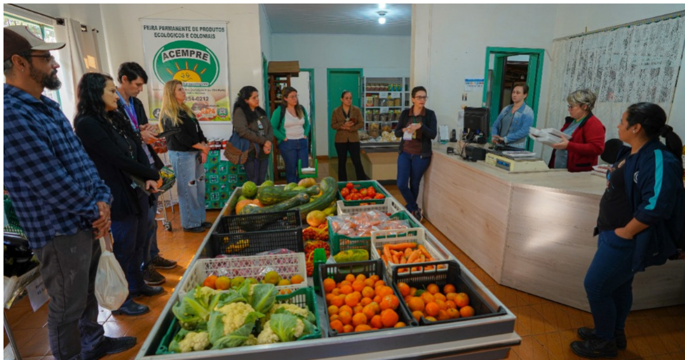
As formações semipresenciais contam com visitas técnicas aos projetos desenvolvidos no território.

Por meio de plataforma online de aprendizagem, em formato educação a distância (EaD), foram contemplados quase cinco mil inscritos. O projeto chegou a todos os estados brasileiros e Distrito Federal, com inscritos de 24 países, a maioria sendo da América Latina. Ao longo de 04 anos de projeto, sete cursos foram lançados com temáticas voltadas para a Sustentabilidade e Gestão Territorial Sustentável. Além disso, um dos cursos foi oferecido em idioma espanhol e português.