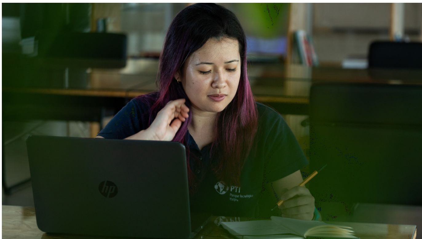
Os cursos da EIS são disponibilizados no formato EaD e semipresenciais.

A Escola Internacional para Sustentabilidade é uma iniciativa educacional desenvolvida pelo Parque Tecnológico Itaipu - Brasil (PTI-BR), em parceria com Itaipu Binacional, com o objetivo de sistematizar a experiência da Usina com as boas práticas de sustentabilidade, desenvolvidas ao longo da sua história.